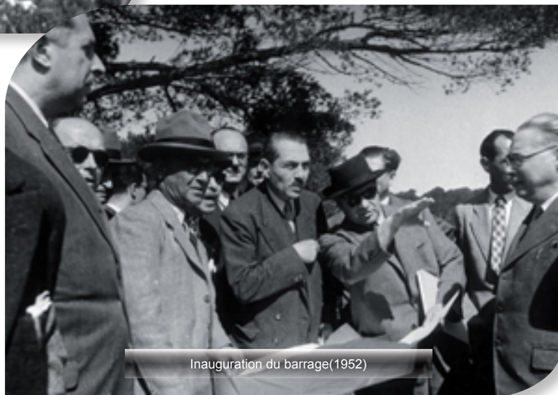
Inauguration du barrage(1952)