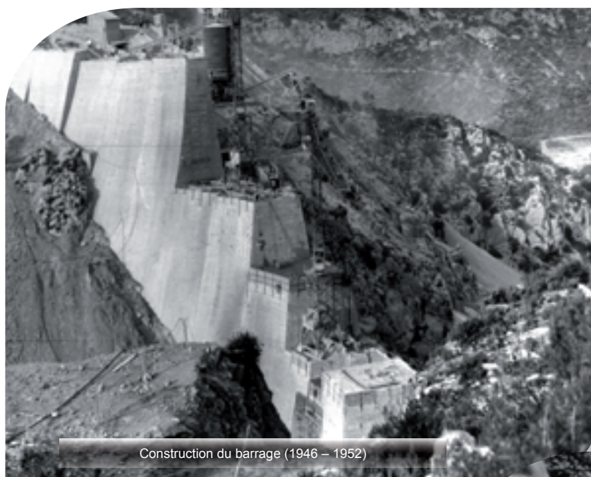
Construction du barrage (1946 – 1952)

Maître d'ouvrage : Conseil Général des Bouches du Rhône, financé dans le cadre du plan Marshall Bureau d'étude : Coyne et Bellier Entreprises de travaux : Entreprise Française de Construction et Travaux Publics et Entreprise Métropolitaine et Coloniale