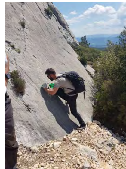
© Stéphanie MOREL – Garde nature