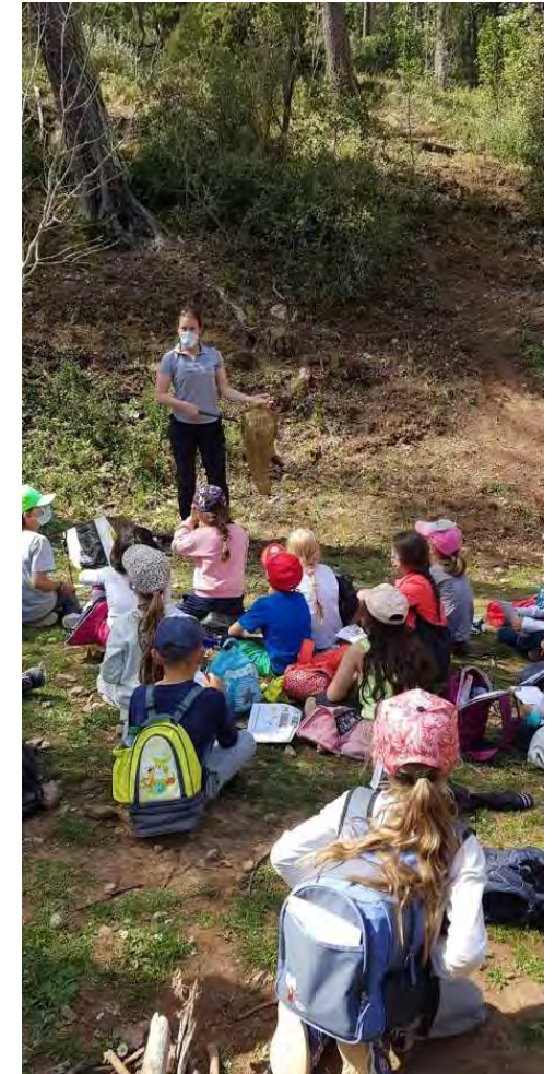
© Stéphanie MOREL – Garde nature