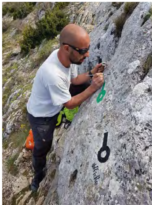
© Stéphanie MOREL – Garde nature

Les gardes-nature ont restauré l'ensemble du balisage pour permettre une lecture plus facile du tracé et ainsi éviter de s'égarer sur des dalles rocheuses où le passage est absolument déconseillé au randonneur non aguerri.