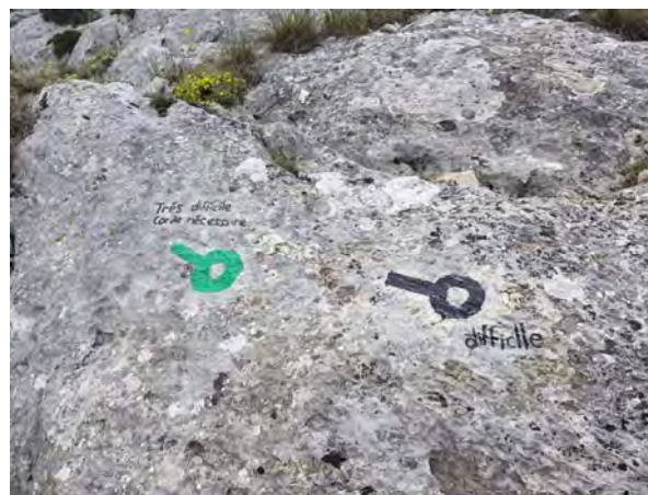
© Stéphanie MOREL – Garde nature