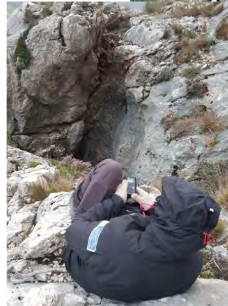
© Stéphanie MOREL – Garde nature