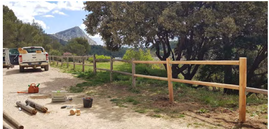
© Stéphanie MOREL – Garde nature