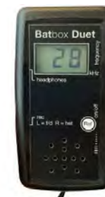
© Stéphanie MOREL – Garde nature