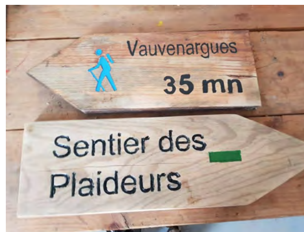
© Stéphanie MOREL – Garde nature